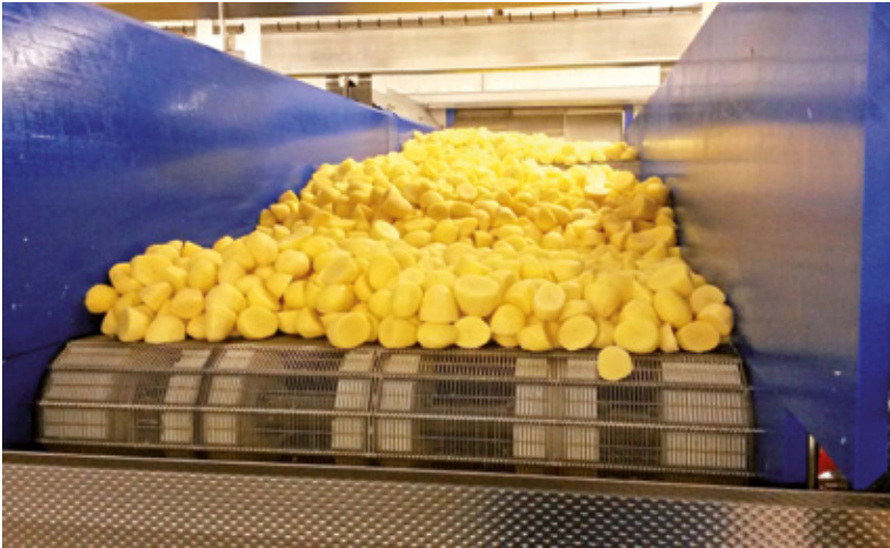
Pufferband: Bis zu 500 Kilo Kartoffeln können auf den beiden Bändern gepuffert werden