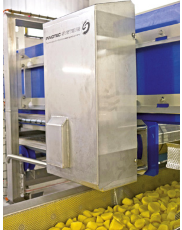
Doppelte Sicherheit: Die Edelstahlhaube deckt den gesamten Motor samt Drehgeber im Betrieb ab

Kartoffeln und einen Bereich, in dem die ungeschälten Kartoffeln gewaschen, sortiert und verpackt werden.