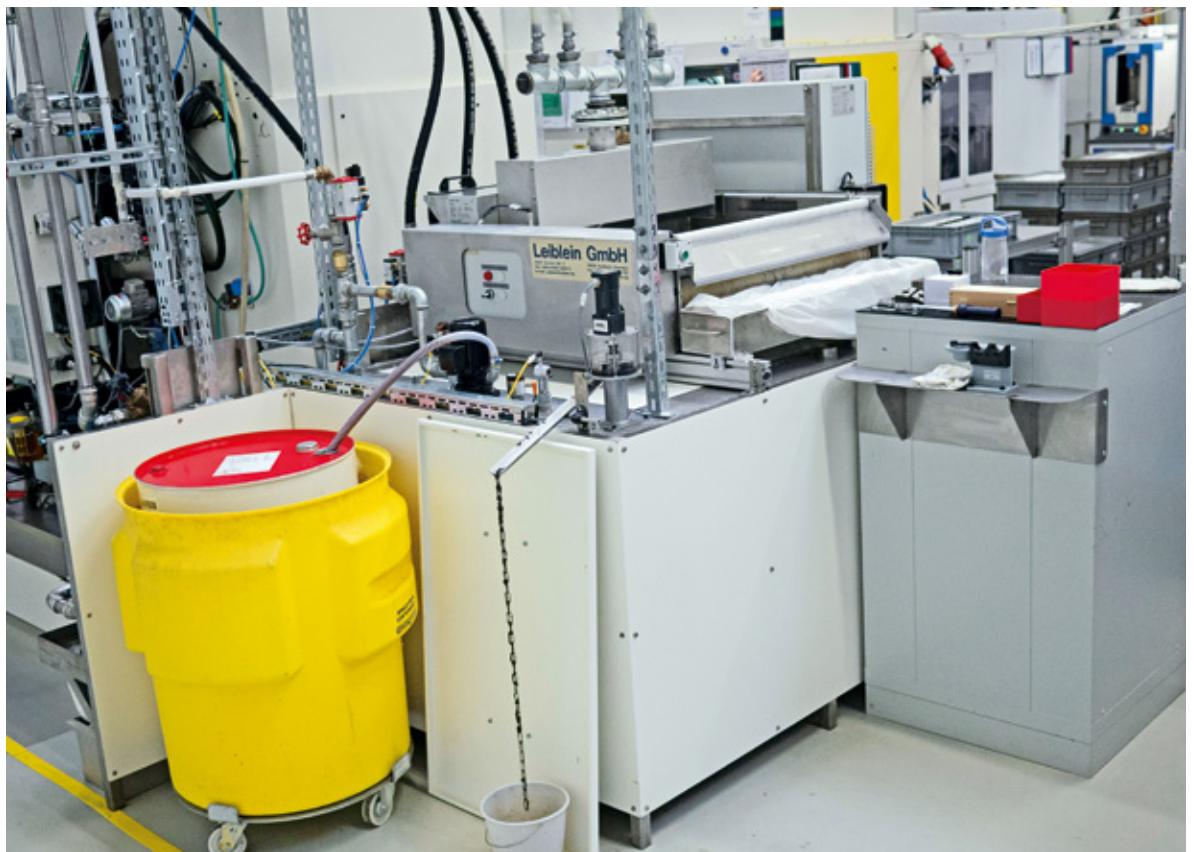
An der Rückseite der Aufbereitungsanlage steht das Fass mit Robsol, RobMations hauseigenem KSS-Konzentrat

Unterstützung durch Turcks Applikationssupport gefragt. Nach dessen Beratung hat man noch die umfangreichere Visualisierungssoftware TX VisuPro installiert, die Turck kostenfrei für seine HMI-Systeme anbietet. Damit lassen sich nun Trendaufzeichnungen wie die Verläufe der zentralen Füllstände, Temperaturen und andere Messdaten performanter darstellen als im Auslieferungszustand. „Auch wenn das TX513 nicht alles von Anfang an so abbilden konnte, wie wir wollten, sind wir mit der Unterstützung durch Tuck auf dem Weg zu einem guten Ergebnis zufrieden. Der