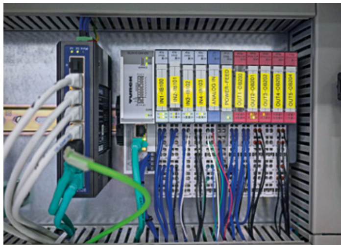
Die zentrale BL20-I/O-Station sitzt an der Zentralschmieranlage und gibt alle Signale über Profinet an das HMI TX513 weiter