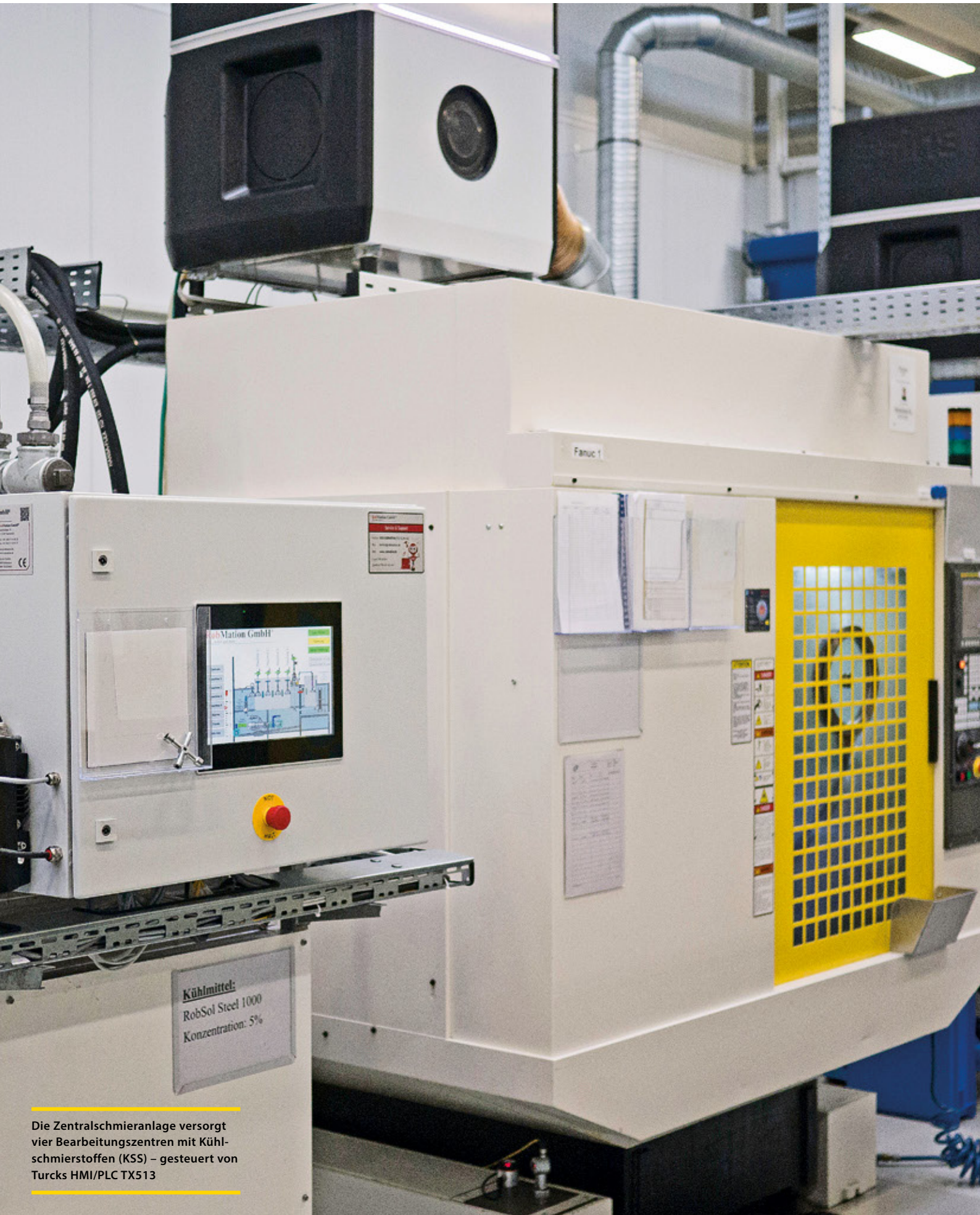
Die Zentralschmieranlage versorgt vier Bearbeitungszentren mit Kühlschmierstoffen (KSS) – gesteuert von Turcks HMI/PLC TX513